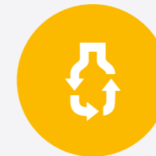
ciclo completo di produzione del vino